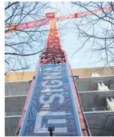
Im Umfeld von Signa gibt es eine weitere Sanierung.

WIEN Eine weitere Firma der Signa-Gruppe steht vor der Insolvenz. Die Bauträger-Tochter BAI Bauträger Austria Immobilien GmbH der nicht insolventen Signa Development hat am Handelsgericht Wien die Eröffnung eines Sanierungsverfahrens ohne Eigenverwaltung beantragt. Die Verbindlichkeiten sollen laut KSV1870 zu Liquidationswerten bei 4,55 Millionen Euro liegen. Betroffen seien 17 Mitarbeiter und 36 Gläubiger.