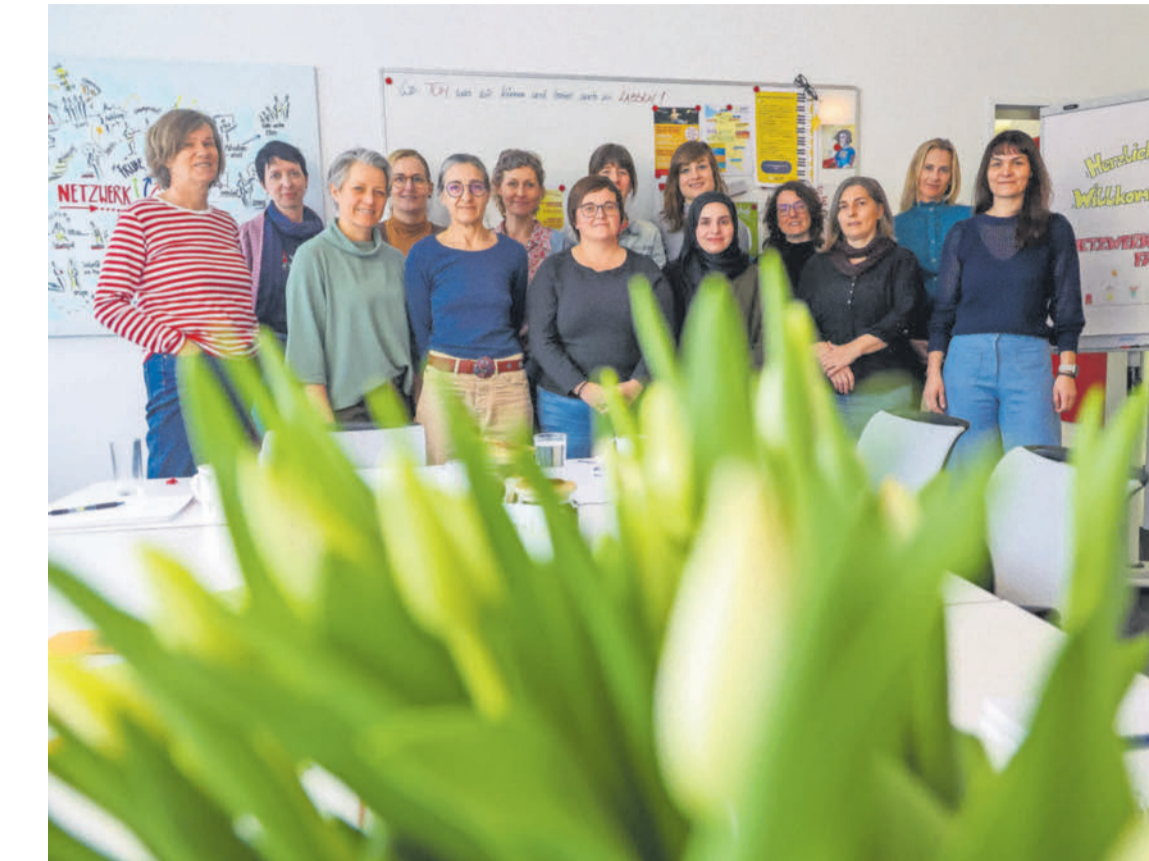
Das Team von Netzwerk Familie trifft sich einmal in der Woche für eine gemeinsame Besprechung in Dornbirn. VN/STEURER

Wir klären, welche Hilfestellung nötig ist, und stehen den Familien bis zu zwei Jahre lang zur Seite“, erklärt die Sozialarbeiterin. Besonders freut sie sich über die jüngst