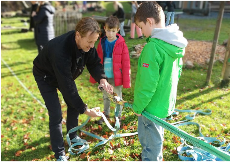
So cool können Ferien sein: Abenteuerwoche Schönenbach.

Geboten werden jede Menge Möglichkeiten, sich zu bewegen, zu spielen und kreativ zu sein – und ganz nebenbei eigene Stärken und Fähigkeiten zu entdecken. Für Be-