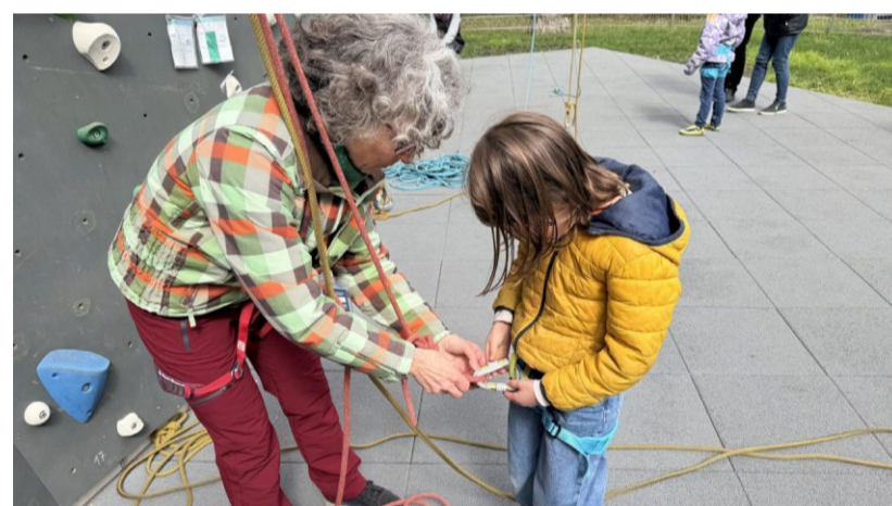
Mit Geduld und Anleitung: Vor dem ersten Aufstieg wird die Sicherung gemeinsam vorbereitet.

Dass der Andrang gerade in den Ferien so groß ist, bestätigt auch das Team vor Ort: „Wir könnten mehr anbieten, als wir abdecken