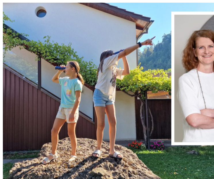
Neue Perspektiven und die Chance für ein besseres Leben für Kinder.

Die Spendensammlung des Vorarlberger Kinderdorfs wird von vielen