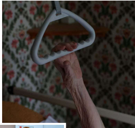
Die Pflegefinanzierung wird zur großen Herausforderung für die Zukunft.